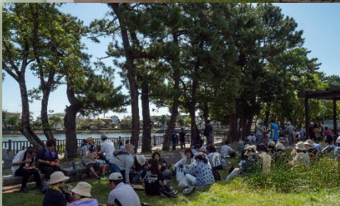
公園でランチタイム