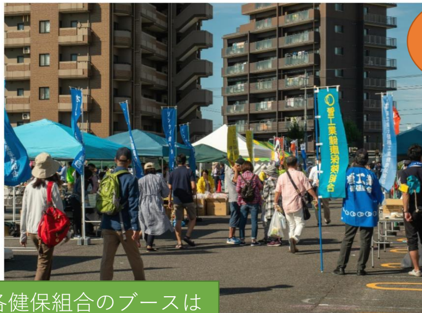
スタート 0.0 km