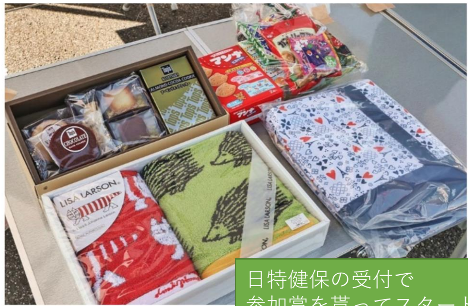
日特健保の受付で 参加賞を貰ってスタート！