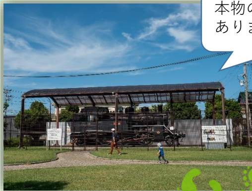
本物のSLが展示して ありました！